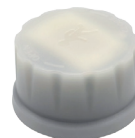
HD06VCRH 7B Détecteur de présence MW