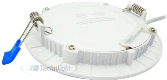
Modèle affiché: WH