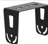
TLHBHUSTU Support en «U»