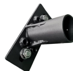
TLSPSFBK Support «slip fitter»